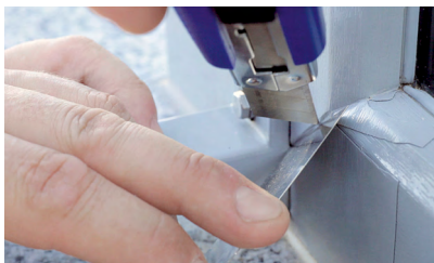
6. Doblar los bordes

Reparación de láminas hecho fácil: con la formación por los expertos de RENOLIT, se convertirá rápidamente en un profesional de la reparación.