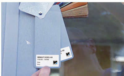
1. Comparar de las láminas

Después de un entrenamiento con RENOLIT reparará los daños en los perfiles laminados casi tan rápido como se han producido.